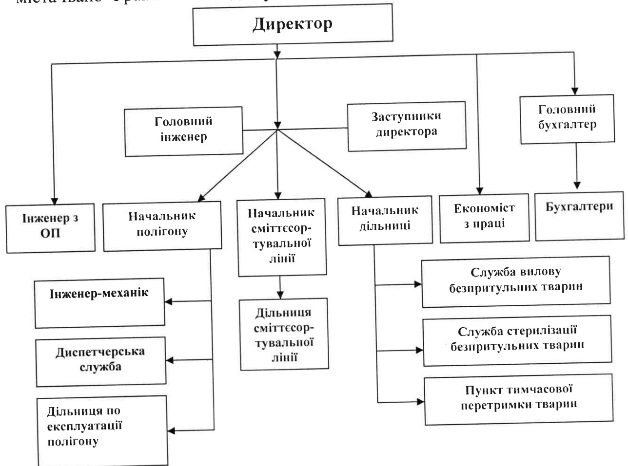
Рисунок 1 - Організаційна структура КП «Полігон ТПВ» станом на 01 січня 2023 року

Керівництво комунальним підприємством «Полігон ТПВ» здійснює директор, який призначається на посаду розпорядженням міського голови міста Івано-Франківська згідно укладеного контракту.